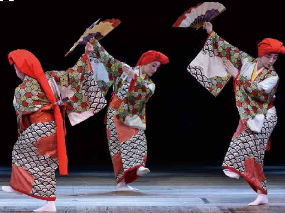
「綾子舞：小原木」創立四五周年記念公演（2017年7月 国立劇場小劇場）